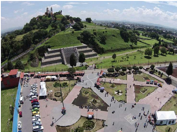
Figura 4 Explanada Parque Soria-Xelhua

Los artesanos refieren que durante décadas sus puestos consistieron en una manta y una sombrilla que colocaban sobre el suelo. Más adelante, con la obtención del nombramiento como Pueblo Mágico, el gobierno municipal les exigió el uso de casetas y estructuras metálicas para vender sus productos (Figura 4).