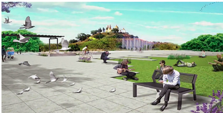
Figura 1 (concluye)