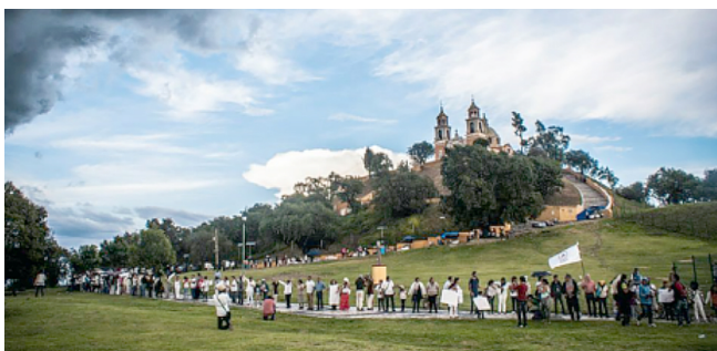
d) Abrazo a la Pirámide