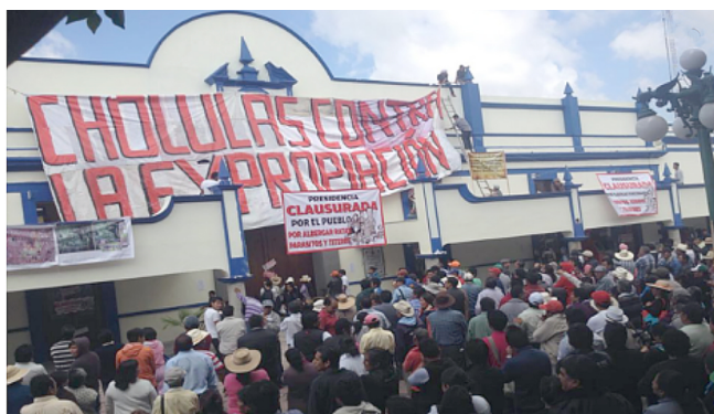
c) Clausura del Palacio Municipal