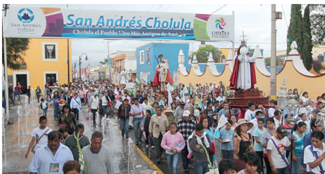
b) Procesión de rogación