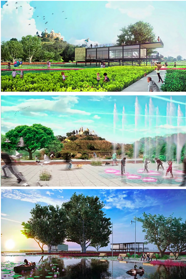
Figura 1 Proyecto original del Parque de las Siete Culturas