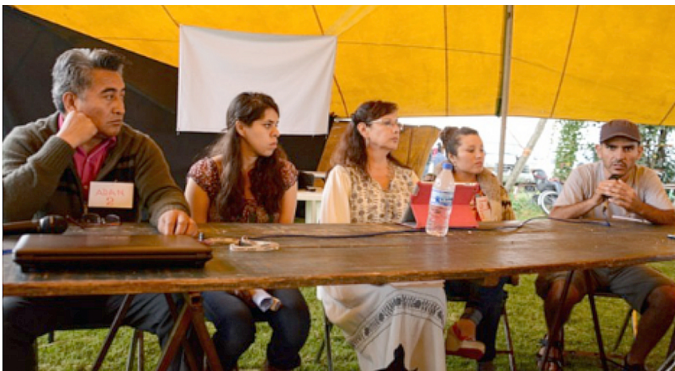
a) Foro Cholula Viva y Digna