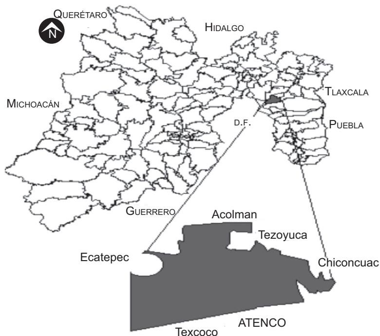
MAPA 1 Ubicación geográfica de Atenco